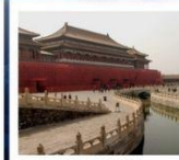
พระราชวังกุ๊กกิง