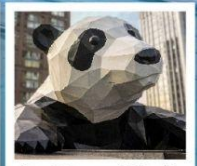
ห้าง IFS แพนด้าป็นตึก