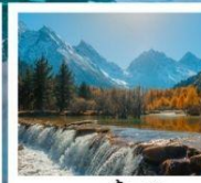
อุทยานปีผิงโกว