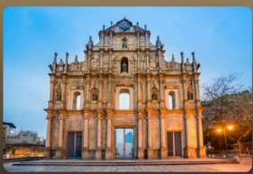
THE ICONIC RUINS OF ST. PAUL'S