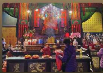
PROSPERITY BLESSING EXPERIENCE