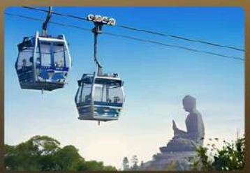
NGONG PING 360 EXPERIENCE